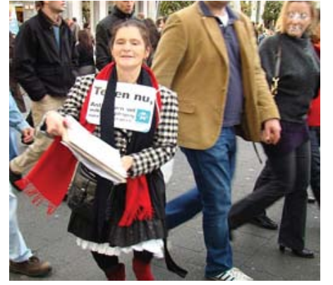
Championne 2700 signatures collectés!