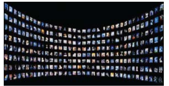
Media ;Infantilisation et illusion du libre choix : Six investisseurs dominent medias occidentaux.