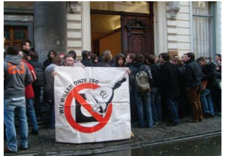
France, Hollande et Irlande votent NON. En Belgique aucun débat populaire.

De plus en plus de gens remettent en question les vrais intentions de l'EU. Le mondialisation du libre-échange est réglémenté par l'Europe et pas libre du tout.