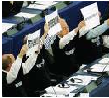
Membres du parlements EU protestent.

Quel bilan pour l'Europe aujourd'hui ? Le débat sur la Constitution européenne a mis en lumière le vrai visage de l'Europe et montre l'écart entre riches et pauvres.