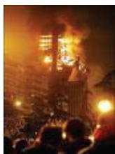
Windsor Madrid tijdens en na de brand