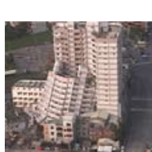
Flat na instorting