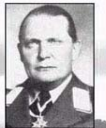
Hermann Goering, Hitler's Reich-Marshal at the Nuremberg Trials after WWII

"Naturally, the common people don't want war, but after all, it is the leaders of a country who determine the policy, and it is always a simple matter to drag people along whether it is a democracy, or a fascist dictatorship, or a parliament, or a communist dictatorship. Voice or no voice, the people can always be brought to the bidding of the leaders. This is easy. All you have to do is to tell them they are being attacked, and denounce the pacifists for lack of patriotism and exposing the country to danger. It works the same in every country."