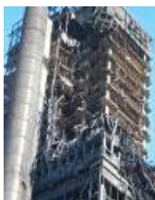
Bouwkunde Delft na brand