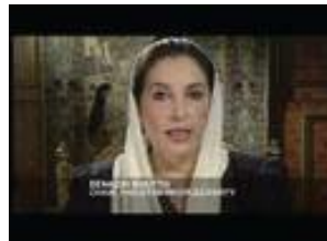
Bennazir Bhutto zegt in een interview bij Al Jazeera met David Frost: 'Ben Laden is vermoord door Omar Sheik in 2001'. Op de voorpagina van de arabische krant Al Wafid en ook op Fox News werd op 26 dec 2001 hier melding van gemaakt.